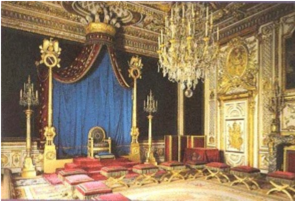
சூழ்நிலை அமைப்பை (1) சமுதாயப் பின்னணி (Social setting), (2) காட்சிப்