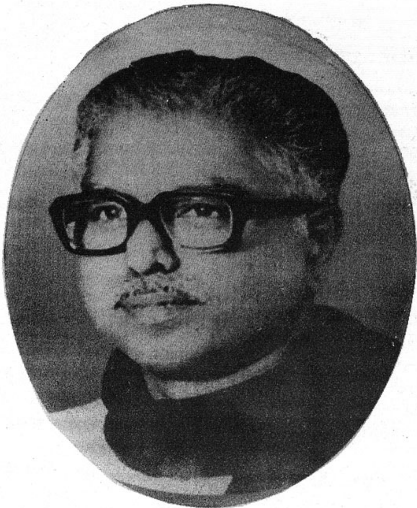
கவியரசர் முடியரசன் 7-10-1920 - 3-12-1998